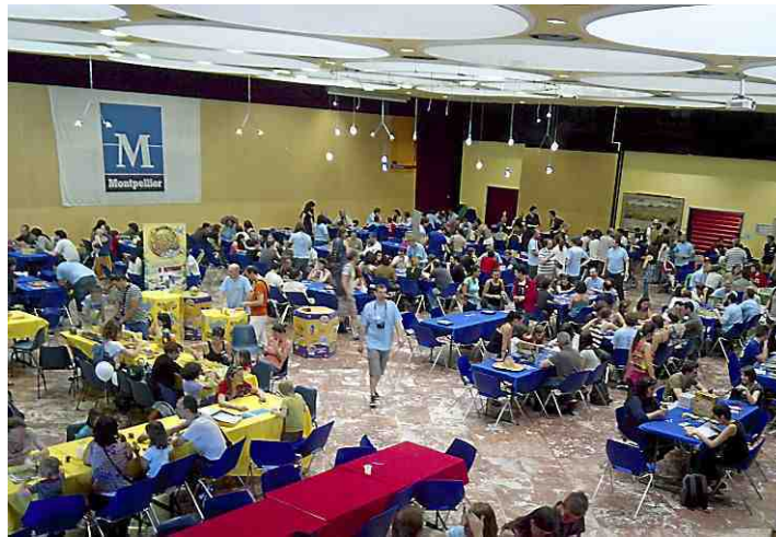
Ce week-end, dans le hall de l'ancien hôtel de ville, venez jouer en famille !